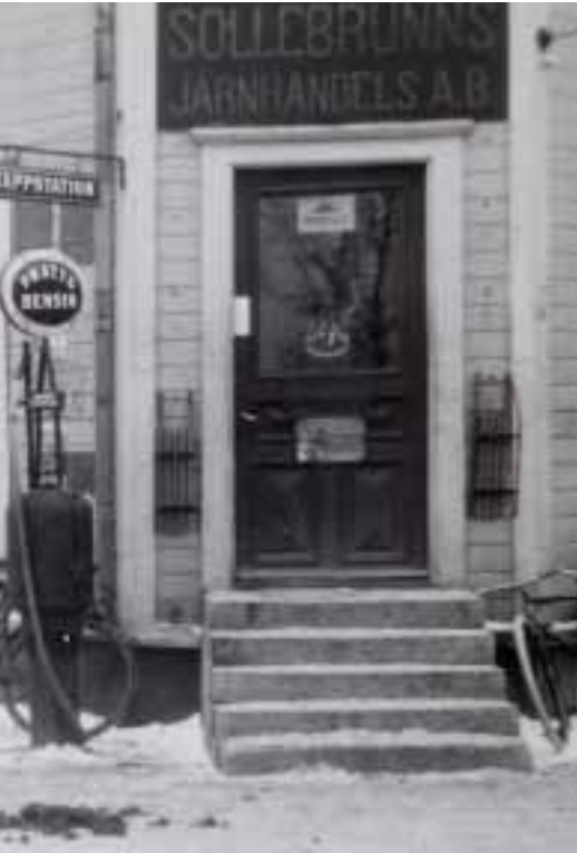
bensin i produktutbudet. Till vänster entré till järn- mamma byggnad.

Sollebrunn, där det idag bor runt 2 500 personer, nästan fördubblades invånarantalet.