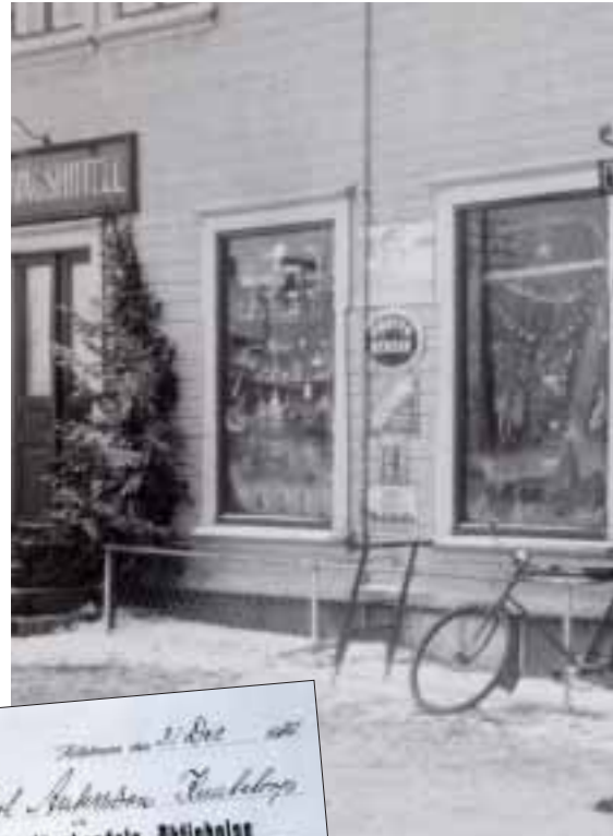
På 1920-talet ingick även vägshotellet som låg i sa