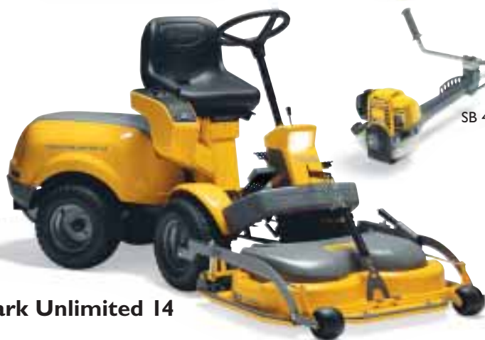
Park Unlimited I4