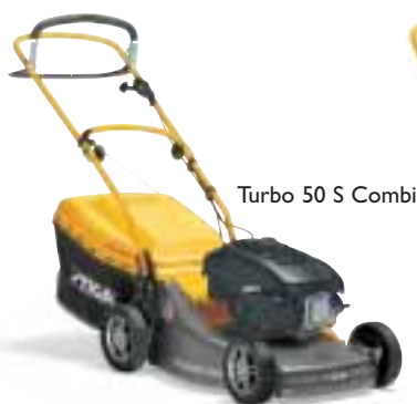
Turbo 50 S Combi