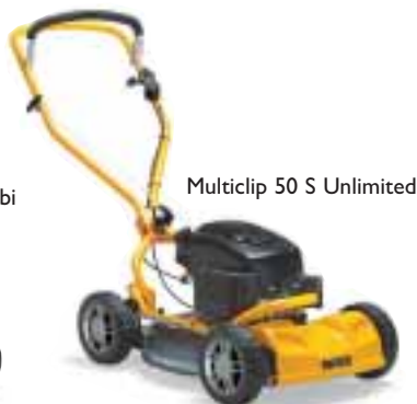
Multiclip 50 S Unlimited